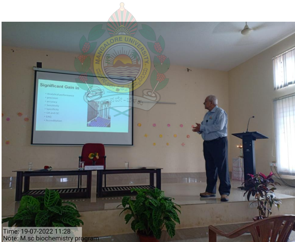
Time: 19-07-2022 11:28 Note: M.sc biochemistry program