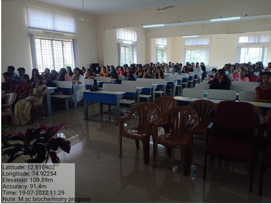
Latitude: 12.816902 Longitude: 74.92254 Elevation: 109.59m Accuracy: 91.4m Time: 19-07-2022 11:29 Note: M.sc biochemistry program