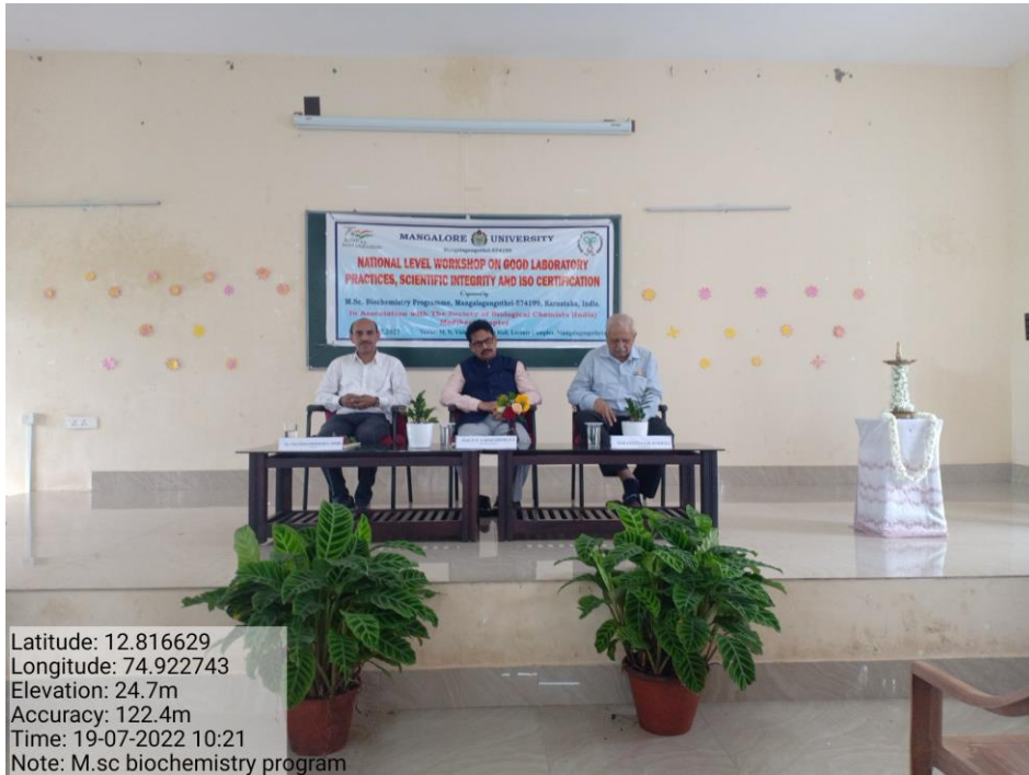
Latitude: 12.816629 Longitude: 74.922743 Elevation: 24.7m Accuracy: 122.4m Time: 19-07-2022 10:21 Note: M.sc biochemistry program